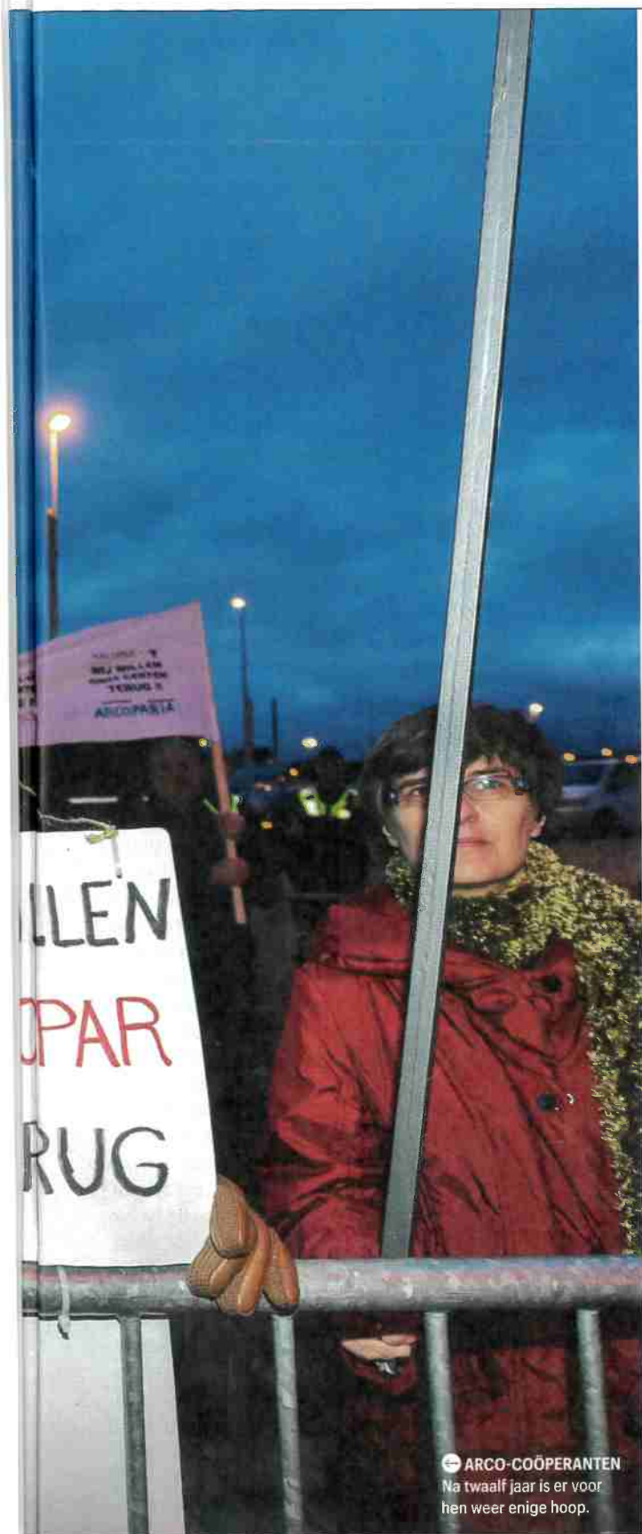
ARCO-COÖPERANTEN Na twaalf jaar is er voor hen weer enige hoop.